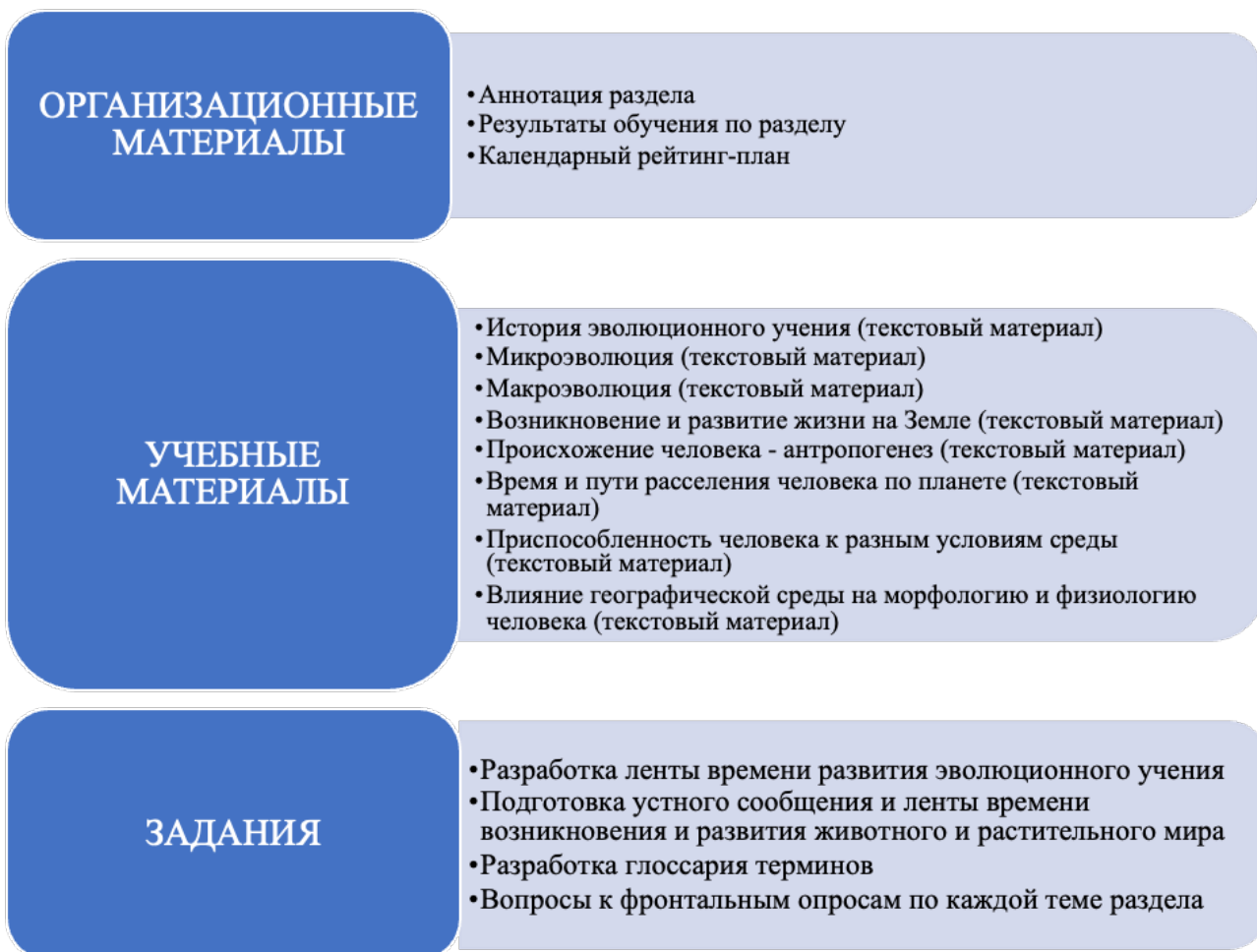
Рис. 1. Фрагмент структуры электронного курса по разделу “Теория эволюции”

Необходимость размещения результатов самостоятельной работы в электронном курсе делает ее выполнение обязательным для обучающихся, что дисциплинирует и повышает ответственность обучающихся. Ключевым механизмом стимулирования самостоятельной работы обучающихся является балльно-рейтинговая система, учитывающая результаты выполнения обучающимися заданий в электронном курсе в итоговой оценке за дисциплину.